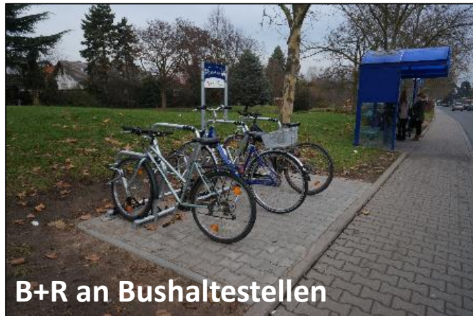
B+R an Bushaltestellen