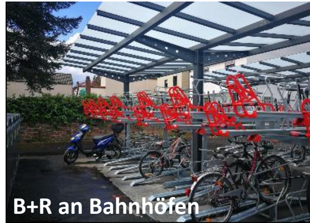
B+R an Bahnhöfen