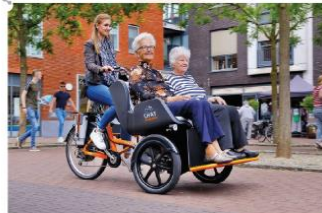
Vielleicht braucht es etwas Mut und Vertrauen, aber die beiden älteren Damen erleben mit der E-Rikscha ganz neue Freiheiten.

Mehrere hessische Alten- und Pflegeheime nutzen Fahrrad-Rikschas, um bewegungseingeschränkten Bewohnerinnen und Bewohnern Ausflüge zu ermöglichen. Die Heime nehmen an einem Projekt teil, bei dem das Land Hessen zusammen mit Partnern E-Rikschas oder E-Tandems zur Verfügung stellt.